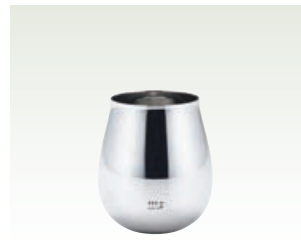
YJ1986 JAN:4979487 919869 磨き屋シンジケート ワインタンブラー 430ml ¥6,000 (税込¥6,600)

●材質:18-8ステンレス●製品寸法:全幅61mm、全高107mm、重量72g●満水容量:190ml●箱寸法:165×110×80mm●箱入重量:190g