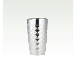
YJ1192 JAN:4979487 911924 磨き屋シンジケート 2重ピアタンブラー 370ml (ダイヤモンドカット仕上げ) ¥9,000 (税込¥9,900)

●材質:外容器・内容器18-8ステンレス●製品寸法:全幅72mm、全高128mm、重量230g●満水容量:370ml●箱寸法:165×110×80mm●箱入重量:320g