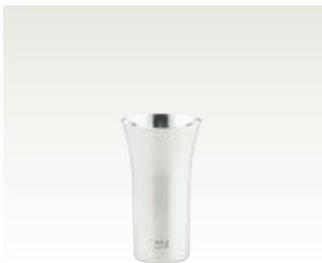
YJ1105 JAN:4979487 911054 磨き屋シンジケート 一口ビール 190ml ¥4,000 (税込¥4,400)

ちょうど飲みやすい大きさのタンブラーです。ビールはもちろん、ウイスキーや焼酎のロック、お湯割りでもお楽しみいただけます。