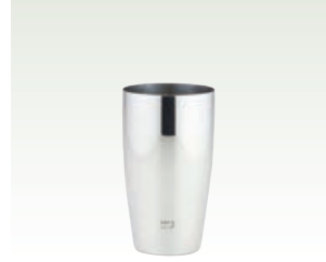
YJ1104 JAN:4979487 911047 磨き屋シンジケート ピアタンブラー 400ml ¥5,000 (税込¥5,500)

●材質:18-8ステンレス●製品寸法:全幅72、全高127mm、重量184g●満水容量:400ml●箱寸法:165×110×80mm●箱入重量:290g