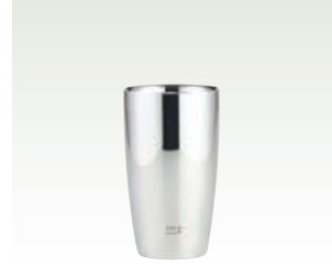
YJ1191 JAN:4979487 911917 磨き屋シンジケート 2重ピアタンブラー 370ml ¥8,000 (税込¥8,800)

●材質:18-8ステンレス●製品寸法:全幅72、全高127mm、重量184g●満水容量:400ml●箱寸法:165×110×80mm●箱入重量:290g