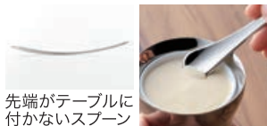
先端がテーブルに付かないスプーン