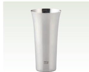
YJ1305 JAN:4979487 913058 磨き屋シンジケート ハイボール・ピアタンブラー 435ml ¥5,000 (税込¥5,500)

●材質:18-8ステンレス●製品寸法:全幅86mm、全高98mm、重量190g●満水容量:430ml●箱寸法:130×130×95mm●箱入重量:260g