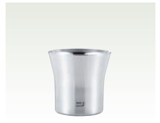
YJ2173 JAN:4979487 921732 磨き屋シンジケート 2重ロックタンブラー 320ml ¥8,000 (税込¥8,800)

●材質:18-8ステンレス●製品寸法:全幅79mm、全高154mm、重量176g●満水容量:435ml●箱寸法:195×110×84mm●箱入重量:300g